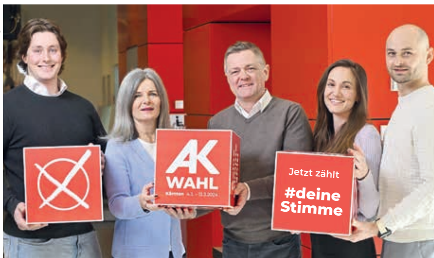
Die AK Kärnten vertritt die Interessen ihrer rund 200.000 Mitglieder. Im März findet die AK-Wahl statt, bei der Sie die Möglichkeit haben, Ihrer Vertretung mit Ihrer Stimme Rückenwind zu verleihen.