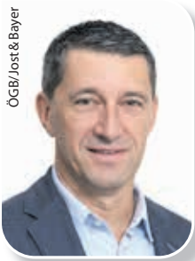
ÖGB/Jost & Bayer